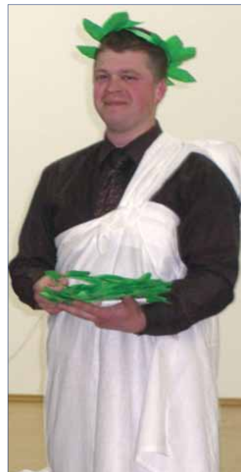
Текст был опубликован в газете «Школьный дом» выпуск #5 (124), 23 февраля 2010 года